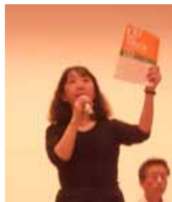
祭典案内最新号の季刊「日本のうたごえ」記事から祭典の魅力を訴えました、轟運営委員長

残された期間、あらためて東京の全サークル合唱団のみなさん実行委員のみなさんに訴えます。