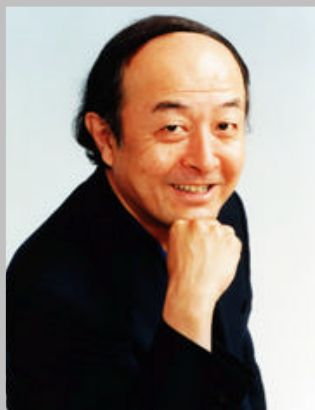
SHIN-ICHIRO IKEBE 池辺 晋一郎